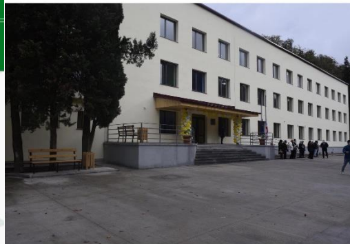
მარელისის საჯარო სკოლა