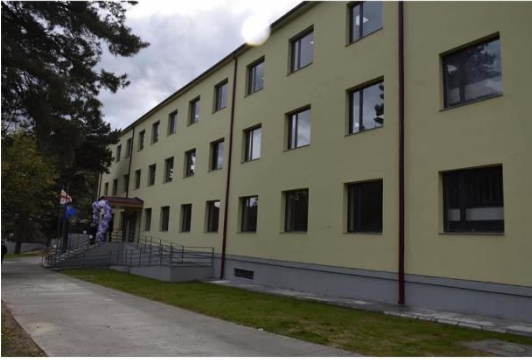
ვერცყვიჭალის საჯარო სკოლა