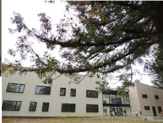
კიციხის საჯარო სკოლა

მოგეხსენებათ, გასული წლის მაისის თვეში, პარლამენტმა მიიღო კანონი, ბავშვთა უფლებების დაცვისა და კეთილდღეობის უზრუნველყოფა.